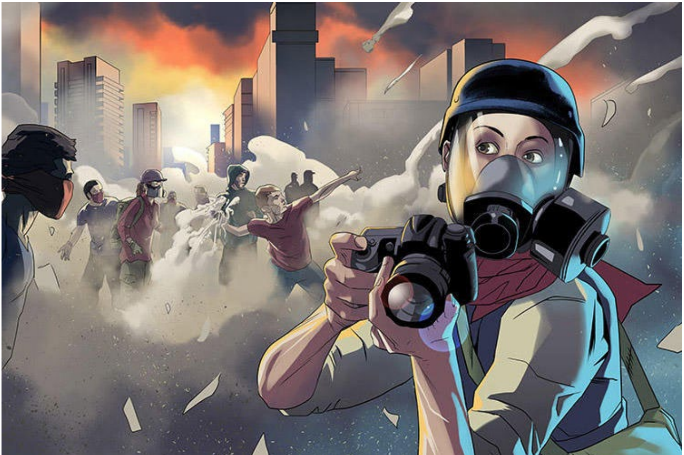
Martial gráfico: Jack Forbes