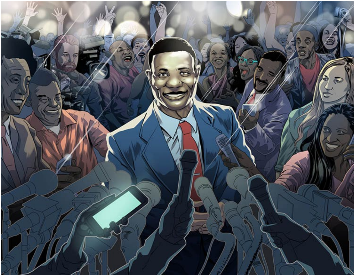
Martial gráfico: Jack Forbes

Guatemala celebrará elecciones generales el 16 de junio. Las elecciones pasadas se han caracterizado por los actos de violencia contra la prensa y este año ha resultado ser igual. En un clima de continuo deterioro de la libertad de prensa, los periodistas guatemaltecos han sido blanco selectivo por su cobertura y enfrentan un incremento del abuso, particularmente en la Internet.