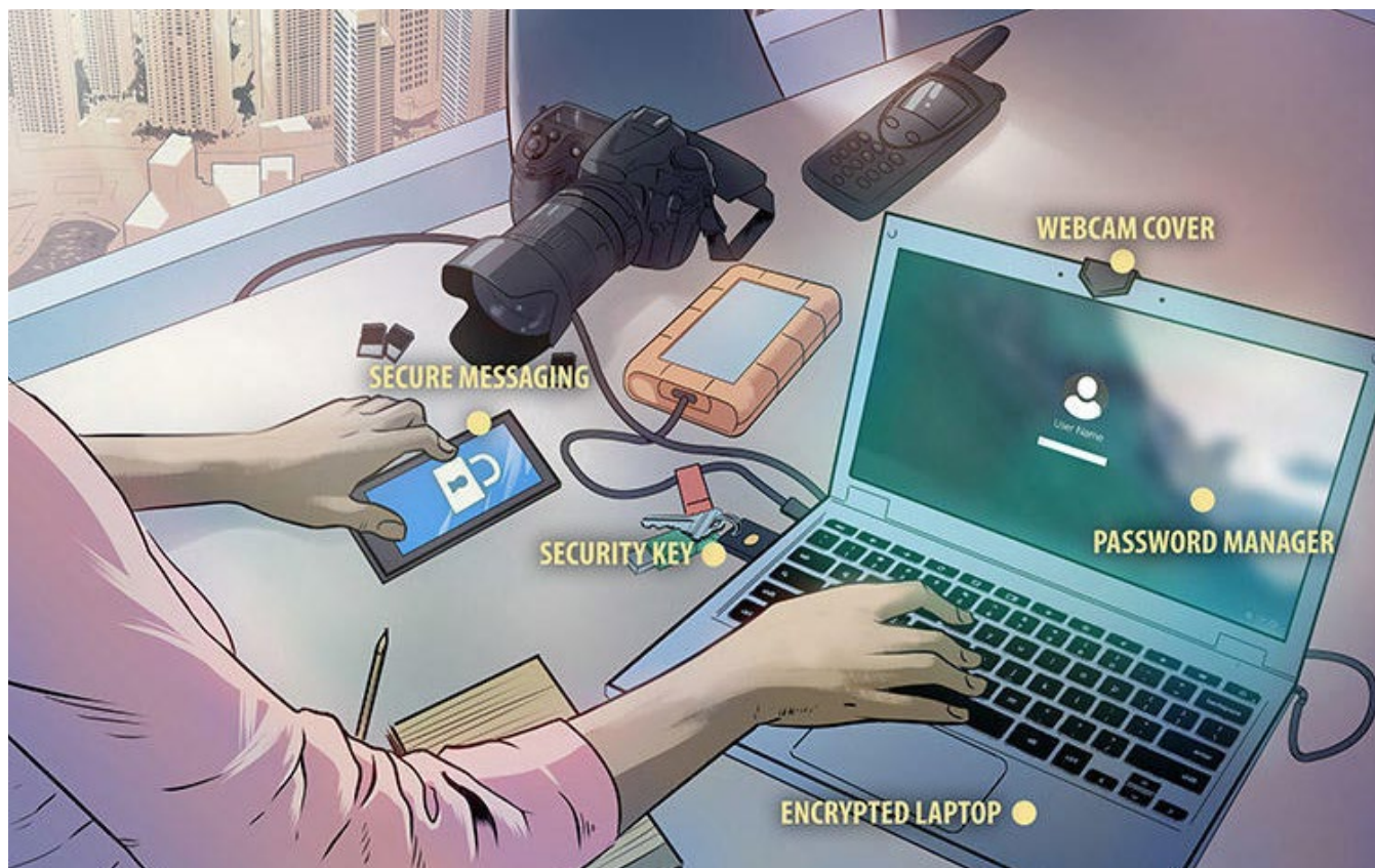
Martial gráfico: Jack Forbes