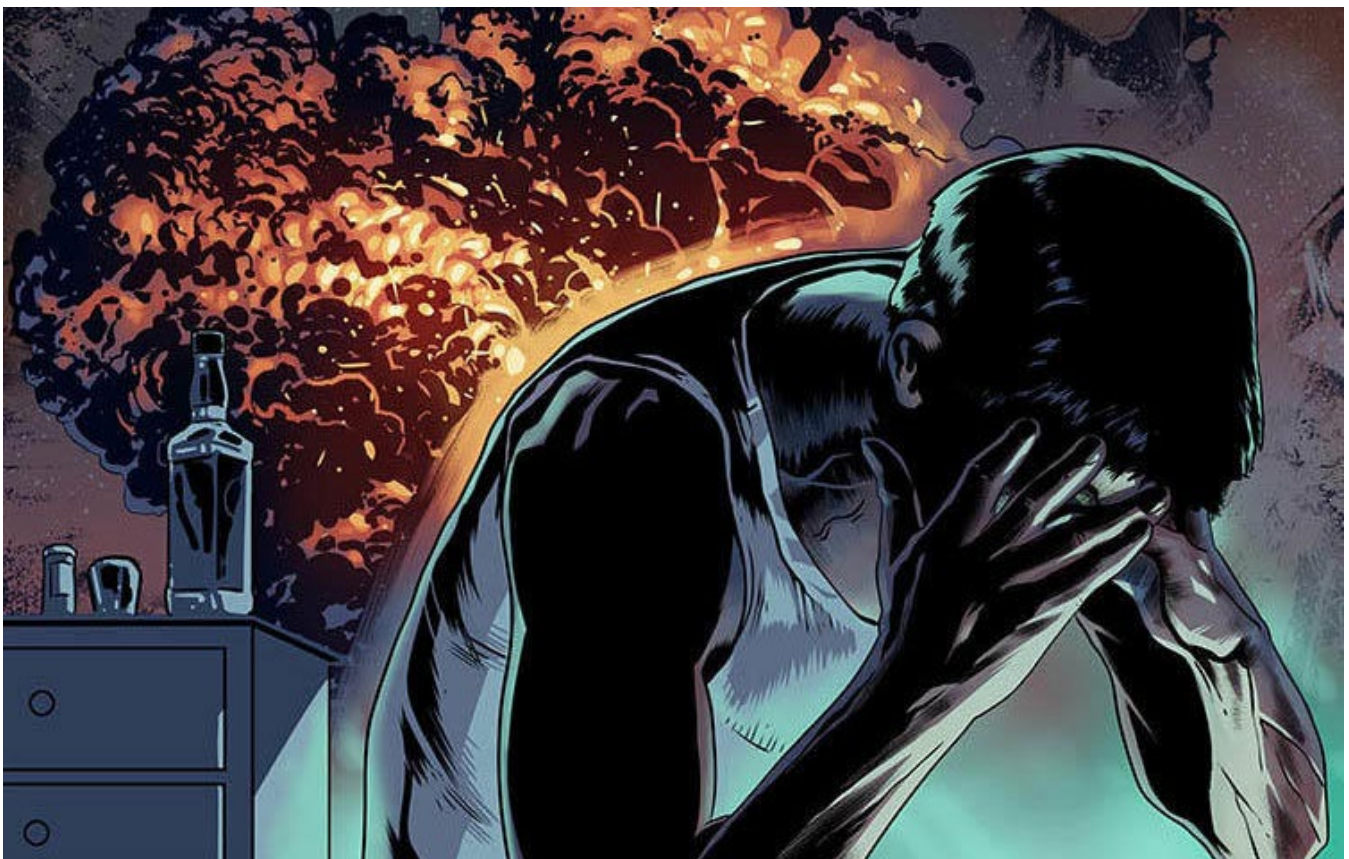
Martial gráfico: Jack Forbes

Es importante que todos los periodistas se den cuenta de que sufrir de estrés luego de presenciar incidentes horribles o luego de ver imágenes de tales incidentes es la reacción humana normal. No es una debilidad.