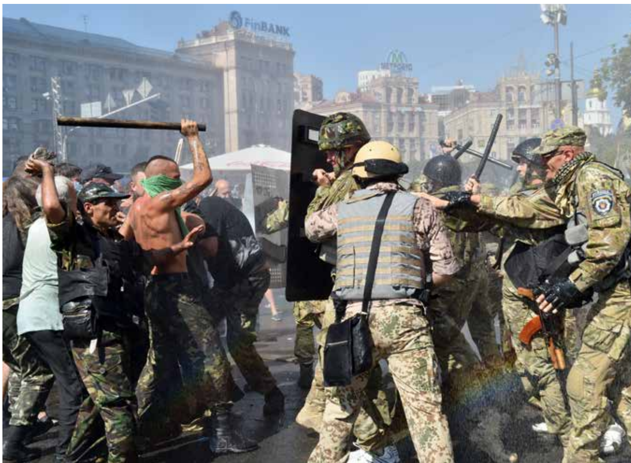
Опис, Акції протесту на Майдані: зіткнення протестувальників з правоохоронцями в Києві під час революції на Майдані у 2014 р. Репортажі Шеремета для СТР суперечили інформації, яку подавали державні російські ЗМІ.

своєрідним сестринським виданням «Української правди». «Це було єдине, що він міг сказати, щоб переконати мене поговорити з ним», – сказала Олена.