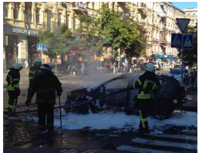
На цій фотографії, зробленій Оленою Притулою до того, як вона зрозуміла, що її цивільний чоловік був у машині, яка вибухнула, пожежники намагаються загасити полум'я на одній із київських вулиць.

Деякі високопоставлені урядовці та співробітники