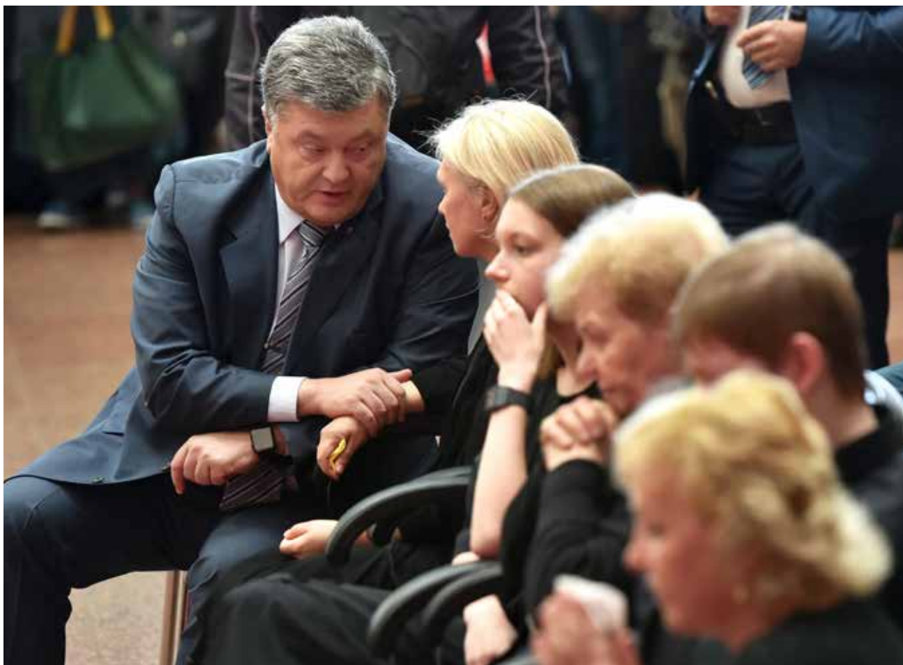
Президент Петро Порошенко розмовляє з родичами Павла Шеремета під час церемонії прощання з журналістом у Києві. Глава держави пообіцяв швидке розслідування, але досі не було названо жодного підозрюваного.

Притули, і сказав, що, на скільки він пам'ятає, все було приблизно так, як розповіла Олена. Він повідомив про свою розмову з Головою СБУ Грицаком щодо цього інциденту і згадав, як Грицак сказав: «Нам нічого не відомо про [спостереження]».