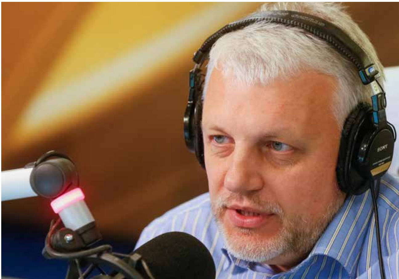
Павло Шеремет виступає в ефірі однієї з київських радіостанцій у 2015 р. Упродовж своєї кар'єри журналіст працював у друкованій пресі, на радіо й телебаченні в Білорусі, Росії та Україні.

не торкалася Павла, оскільки його нога «відвалювалась», ледве тримаючись за шкірний покрив.